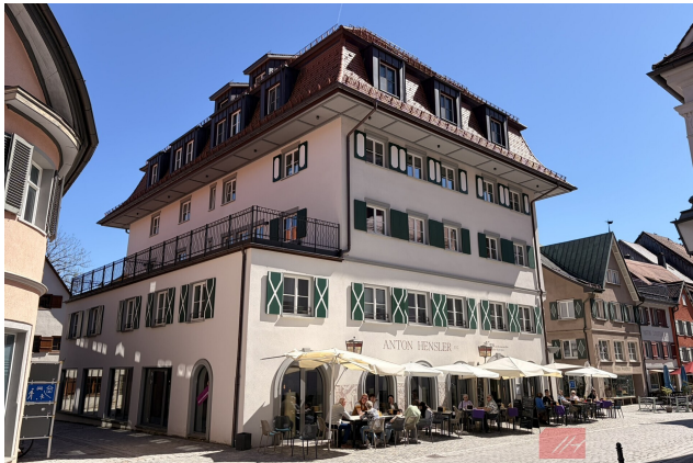
Ansicht von Außen