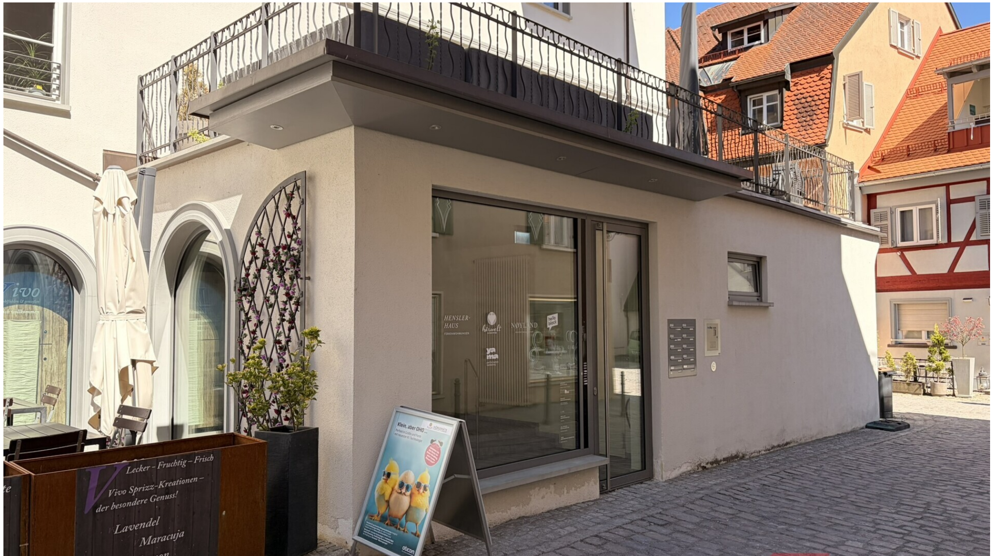
Eingang zum Treppenhaus